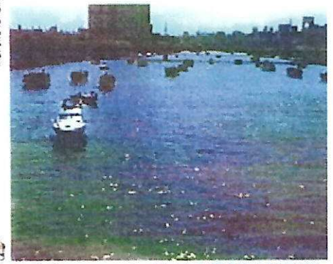
吾妻橋から吾妻橋方面の眺望