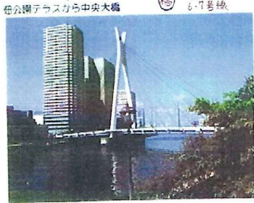
浜町公園テラスから中央大橋