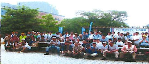
浜町公園で参加者