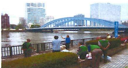
ルート3:石川島公園