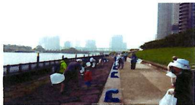
親水テラスを清掃