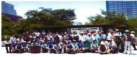
清掃を終えて記念撮影