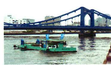
東京都建設局の清掃船が協力